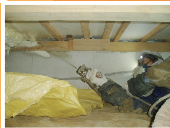
床下での断熱材設置作業の様子